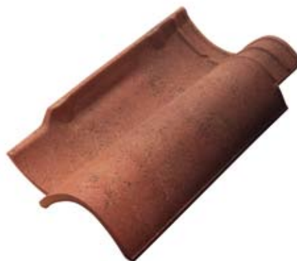
Antichizzata Classica Pica

Hagyomány új formában: a NovoCoppo tetőcserép új formájával egyszerűsíti a lerakási módszereket és egyben megtartja a tradíciókat is. Ez a tetőcserép a kulturális örökség és az új technológia tökéletes kombinációja.