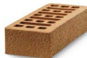
Antik rózsaszín téglá