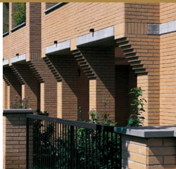
Antik rózsaszín homlokzati burkolótégla