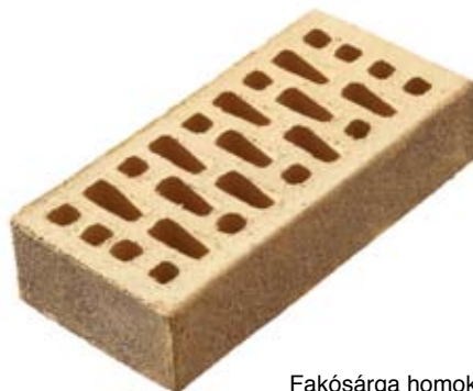
Fakósárga homokolt gépi gyártású homlokzati burkolótégla

A Pica több mint 20 típusú homlokzatburkoló téglát készít, 4 különböző színben, 6 kivitelben és 4 méretben. A palettát habarcsos és ragasztott takarótégla, valamint sarokelem teszi teljessé.