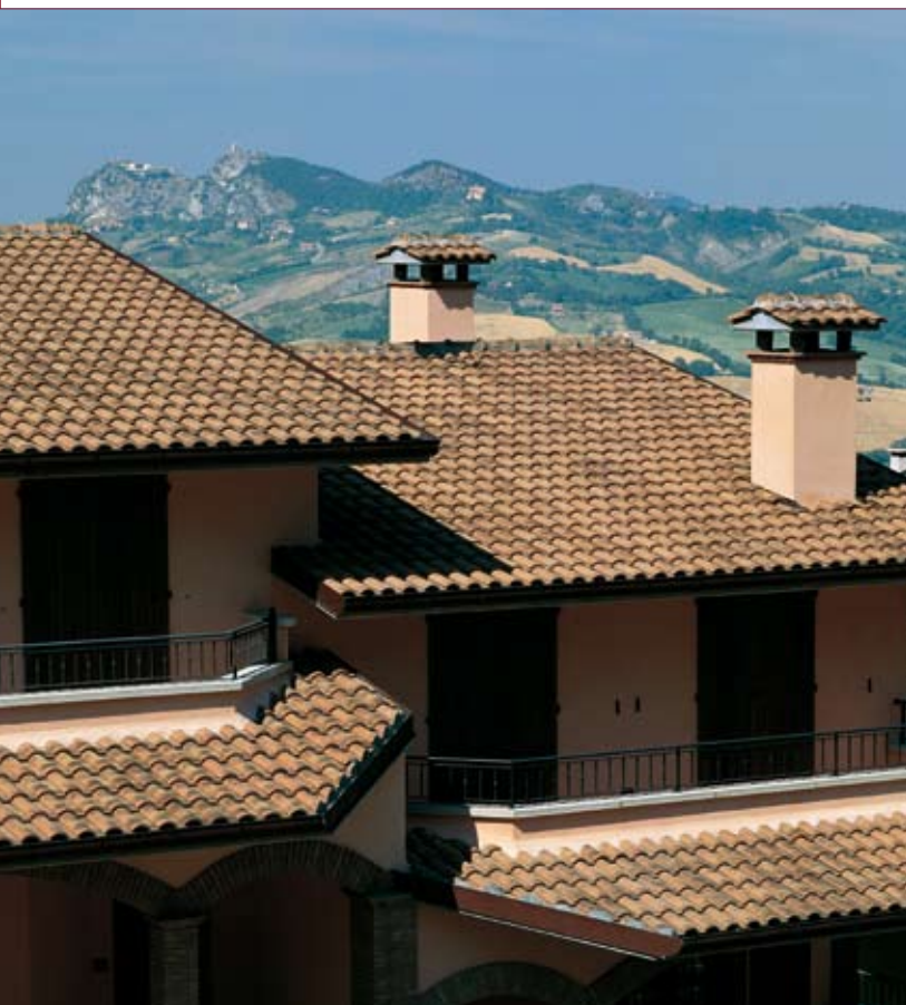
Antichizzata Classica Pica

Tipikus mediterrán stílusával ez az Olaszországban, Dél-Franciaországban, Görögországban és Spanyolországban legelterjedtebb tetőcserep. A magas hullámú tetőcserepek természetes fejlődését képviseli, és felidézi a régi római tetőket. Különböző színekben és négy antikolt kivitelben kapható.